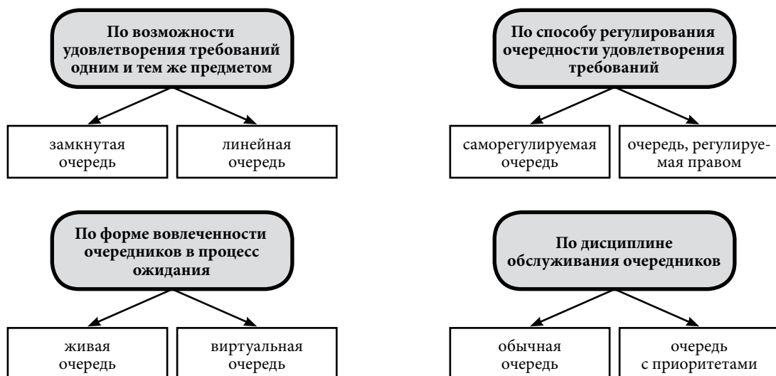
Рис. 1. Классификация понятия «очередь»

Согласно теории очередей с точки зрения возможности удовлетворения требований или